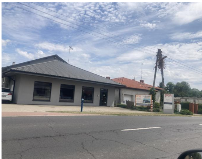
Część A - firma BRM Meble