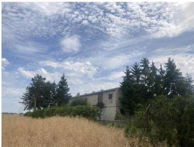
Część A - budynek gospodarczy