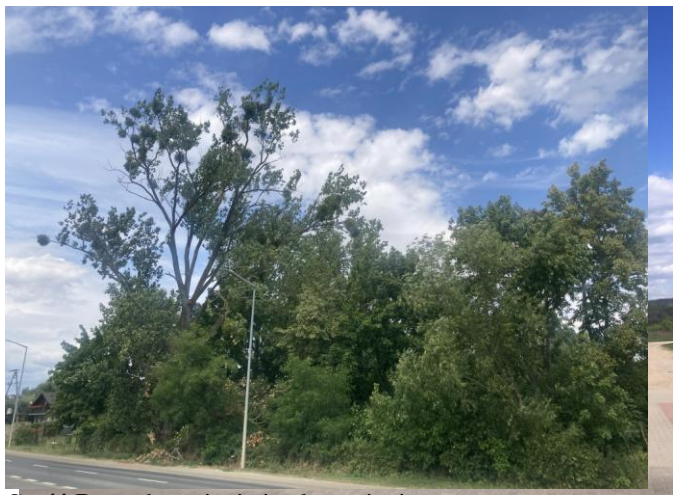
Część B - zadrzewienia i zakrzewienia Tereny niezagospodarowane w obrębie planu