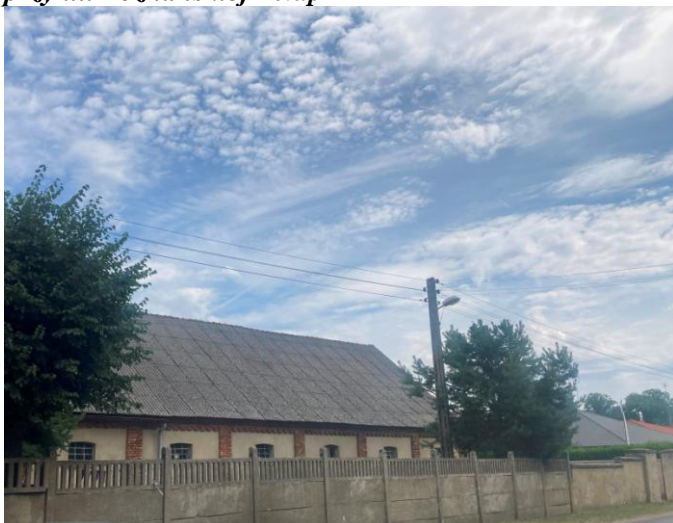
Część A- budynek wpisany do gminnej ewidencji zabytków