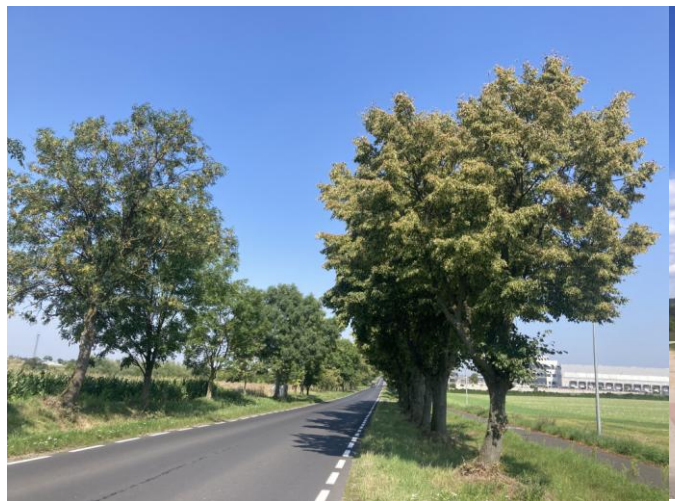
Tereny niezagospodarowane w obrębie planu