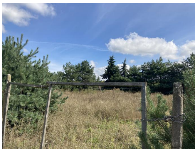
Teren działki nr 26/1