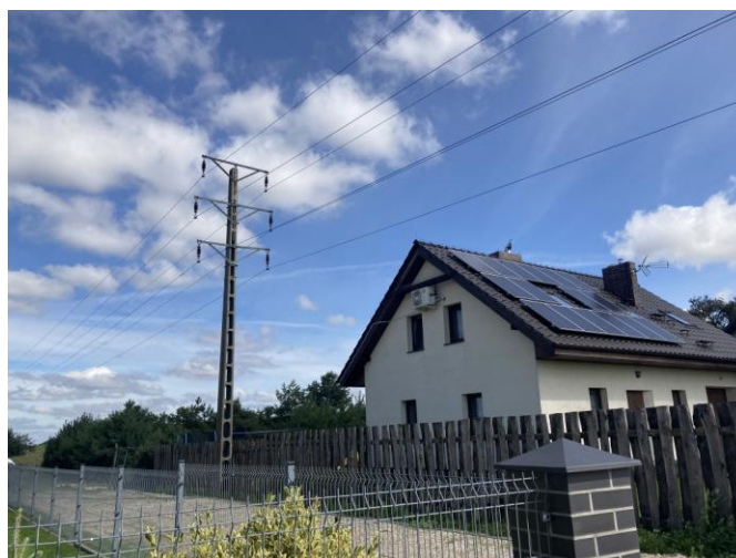
Droga wewnętrzna na fragmencie działki 25/1