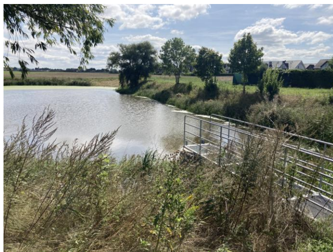
Zbiornik retencyjny - widok od ulicy Szkolnej