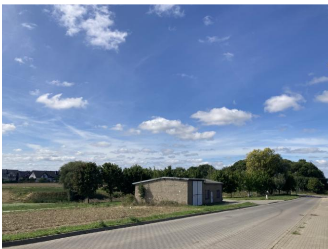
Teren gminny - widok od ulicy Nowej