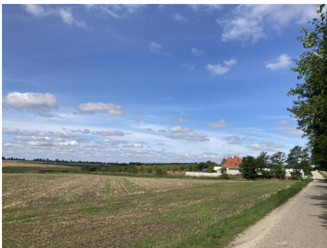
Tereny użytkowane rolniczo na działce nr 56