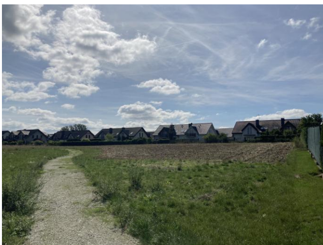
Tereny zabudowy mieszkaniowej jednorodzinnej